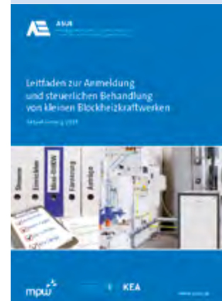
Leitfaden zur Anmeldung und steuerlichen Behandlung von kleinen Blockheizkraftwerken Bestellnummer 309887