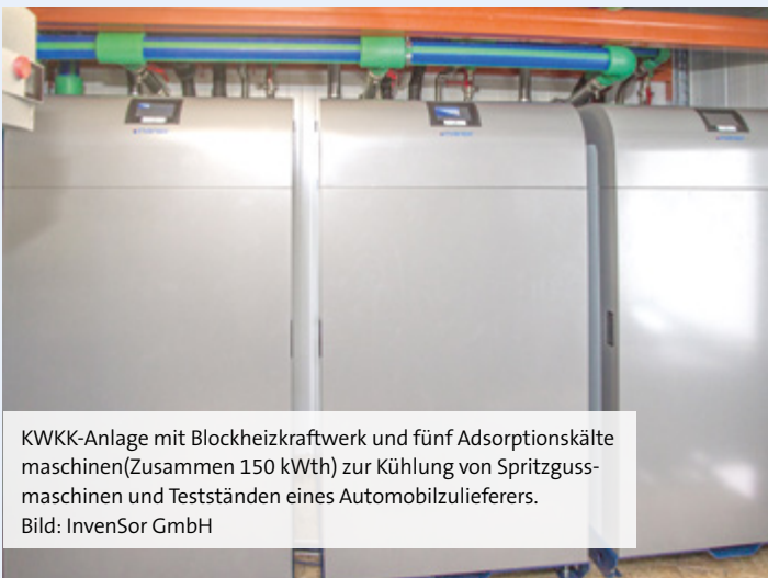
KWKK-Anlage mit Blockheizkraftwerk und fünf Adsorptionskältemaschinen (Zusammen 150 kW th ) zur Kühlung von Spritzgussmaschinen und Testständen eines Automobilzulieferers.

Mit der Digitalisierung hat die erforderliche Rechen- und Speicherleistung in den meisten Unternehmen und Verwaltungen stark zugenommen. Die elektrische Leistungssteigerung geht mit erhöhten Wärmemengen einher, die aus den meist innenliegenden Serverräumen abgeführt werden müssen, um die Rechenleistung zu erhalten. Durch die kontinuierlich anfallende Abwärme und den gleichmäßigen Bedarf an Kälte finden sich hier optimale Einsatzbedingungen für KWKK-Anlagen.