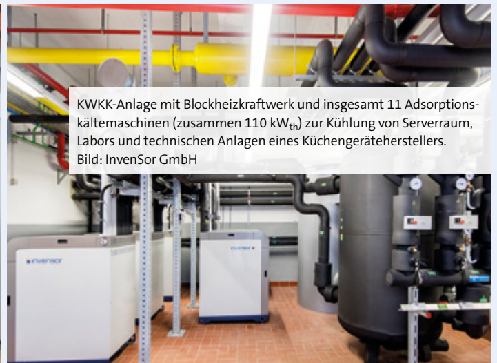
KWKK-Anlage mit Blockheizkraftwerk und insgesamt 11 Adsorptionskältemaschinen (zusammen 110 kW th ) zur Kühlung von Serverraum, Labors und technischen Anlagen eines Küchengeräteherstellers.